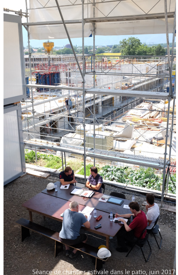
Séance de chantier estivale dans le patio, juin 2017

Un lieu de découverte du projet destiné aux acteurs du chantier et au public. Cet espace reçoit une exposition évolutive concernant l'avancement du chantier (présentation des plans et maquettes du chantier, disposition des appartements, matériaux, etc...) tout comme des expositions artistiques ponctuelles.